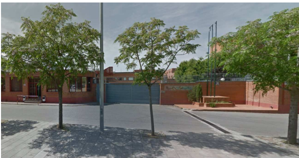
Porta principal CPP: Disposa de sensors de seguretat pel tancament

En aquest sentit la USPAC vol posar fil a l'agulla i denunciar una sèrie mancances que es descriuen a continuació: