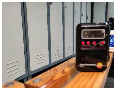
29°C VESTIDORS DONES