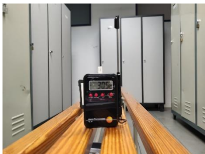
30.5°C VESTIDORS HOMES

Divendres 13 d'agost de 2021, el delegat de prevenció de riscos laborals i el delegat de la RPMN de la USPAC , van estar agafant temperatures a Santa Coloma de Gramenet. Aquesta era la situació a última hora de la tarda: